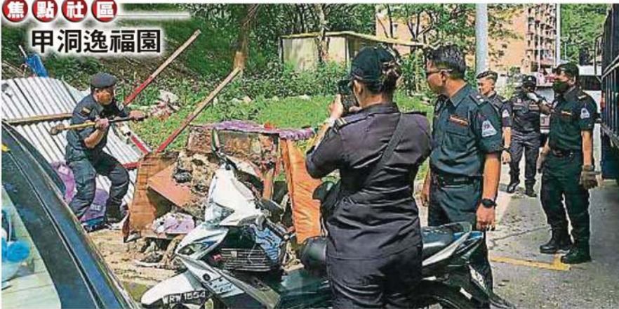
市议会出动10名执法人员前往甲洞逸福园取缔霸占停车位和非法营业的路边摊。