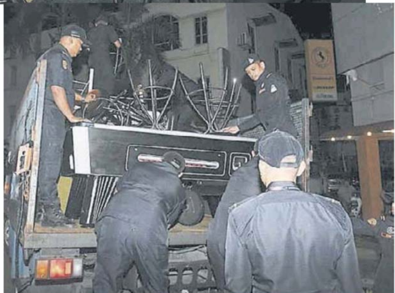
娱乐场所和按摩院也遭取缔。

市议会强调,即使该区非法小贩遭取缔,惟市议会将持续监督,确保小贩营业的地方环境卫生,市议会也不会容忍无执照营业的娱乐场或按摩院。