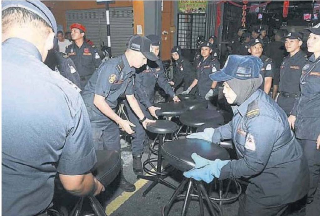
市议会官员将非法小贩的桌椅等物件充公。

(万撓16日讯)士拉央市议会日前在万撓公主湖城美丹布特里附近展开突检行动,取缔非法小贩、按摩院和娱乐场,并充公违例业者的营业器具。