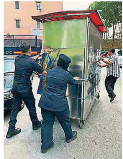
执法人员将其中一个可移动的摊位充公，并以市议会的罗里载走。