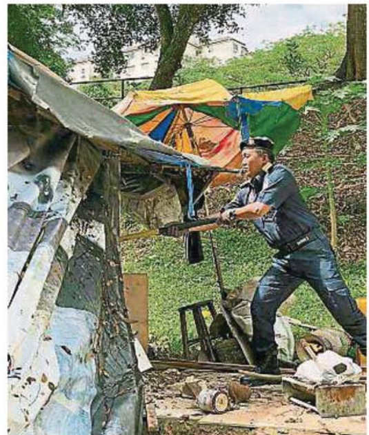
执法人员拆除小贩自行搭建的摊位。

执法行动，务必通过正确管道与市议会沟通，不要因情绪失控而演变成引起轩然大波的事件。