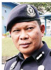
阿里菲证实警方逮捕 2 名涉嫌恐吓及阻差办公的印裔男子。