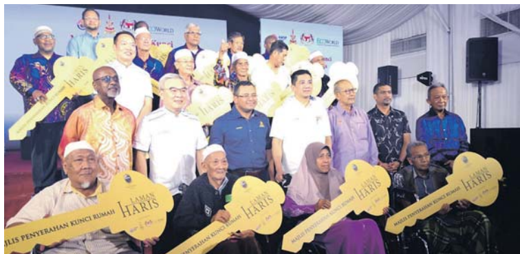
Mohamed Azmin (berdiri empat dari kanan) bergambar bersama sebahagian peneroka pada Majlis Penyerahan Kunci Rumah Laman Haris kepada Peneroka Rancangan Revolusi Hijau Peringkat 2 dan 3 Mukim Ijok semalam.

Menteri Hal Ehwal Ekonomi, Datuk Seri Mohamed Azmin Ali berkata, harga hartanah di kawasan yang dilengkapi kemudahan pembangunan infrastruktur dan prasarana lengkap itu dijangka terus mening-