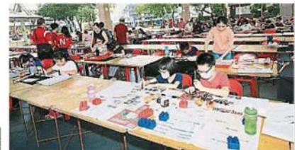
受到新冠肺炎疫情影响,只有60名参赛者出席“美门街头挥春比赛2020”,占报名人数的一半。

他说,新冠肺炎的疫情也严重影响我国的经济,尤其是旅游业,因此财政部正准备紧急的对策,帮助减轻商家的负担,也希望可刺激到我国下半年的经济并恢复增长率,详情将由部长在本月27日公布。