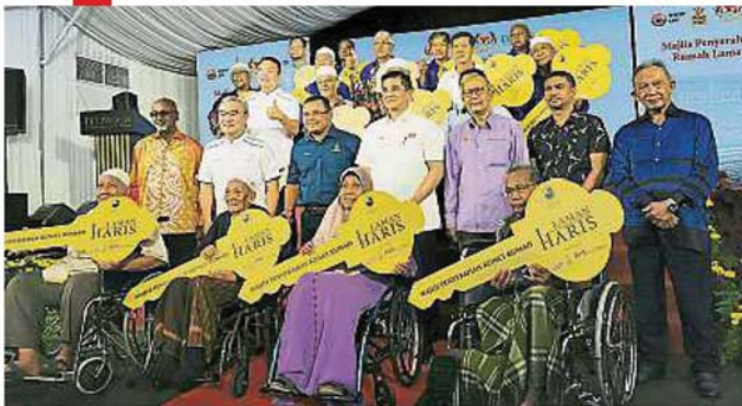
阿兹敏（次排中）移交房屋锁匙给垦殖民代表，次排左二起为刘启盛和阿米鲁丁。

（瓜雪16日讯）经济事务部长拿督斯里阿兹敏指出，政府在振兴经济配套中将加强本地投资和推动国内旅游，以应对新冠肺炎所带来的经济冲击。