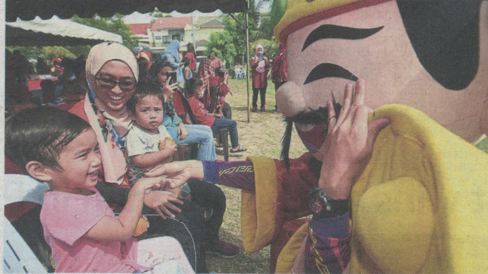
God of Prosperity entertaining a child at the Bandar Tun Hussein Onn Suasana Chinese New Year celebration.

“We already have a line-up of activities for the year, including celebrations for other festivals. Today’s event is the highlight of the month,” he said.